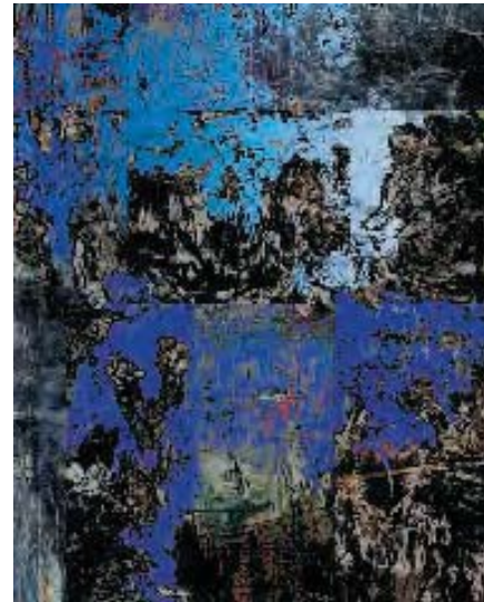
Christian Schütz »M-03« (M = Michelangelo) 2002, 140cm x 112 cm

hundert Einzelbildern. Diesen Prozess der Bildentstehung kann man gleichsetzen mit einem Erkenntnisvorgang«, schrieb er. Sein Ideal ist eine mathematisch-architektonisch strenge Kunst, die höchste Emotionalität vermittelt. So hat er Bachs Musik, akustische Schwingungen oder Migrationsbewegungen visualisiert, Bildfolgen mit archaischen Zeichen oder auf der Grundlage von Röntgenaufnahmen entwickelt.