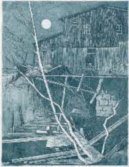
Helmut Müller »Blaue Stunden« 2001, Farbradiertung, 16 cm x 13,5 cm