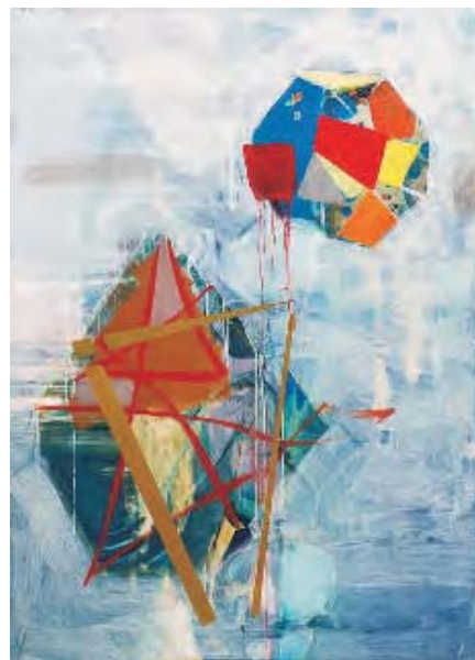
Tegene Kunbi Malerei