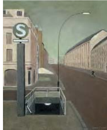
Hannelore Teutsch »Berliner Straße« Öl auf Leinwand, 2010 60 x 50 cm